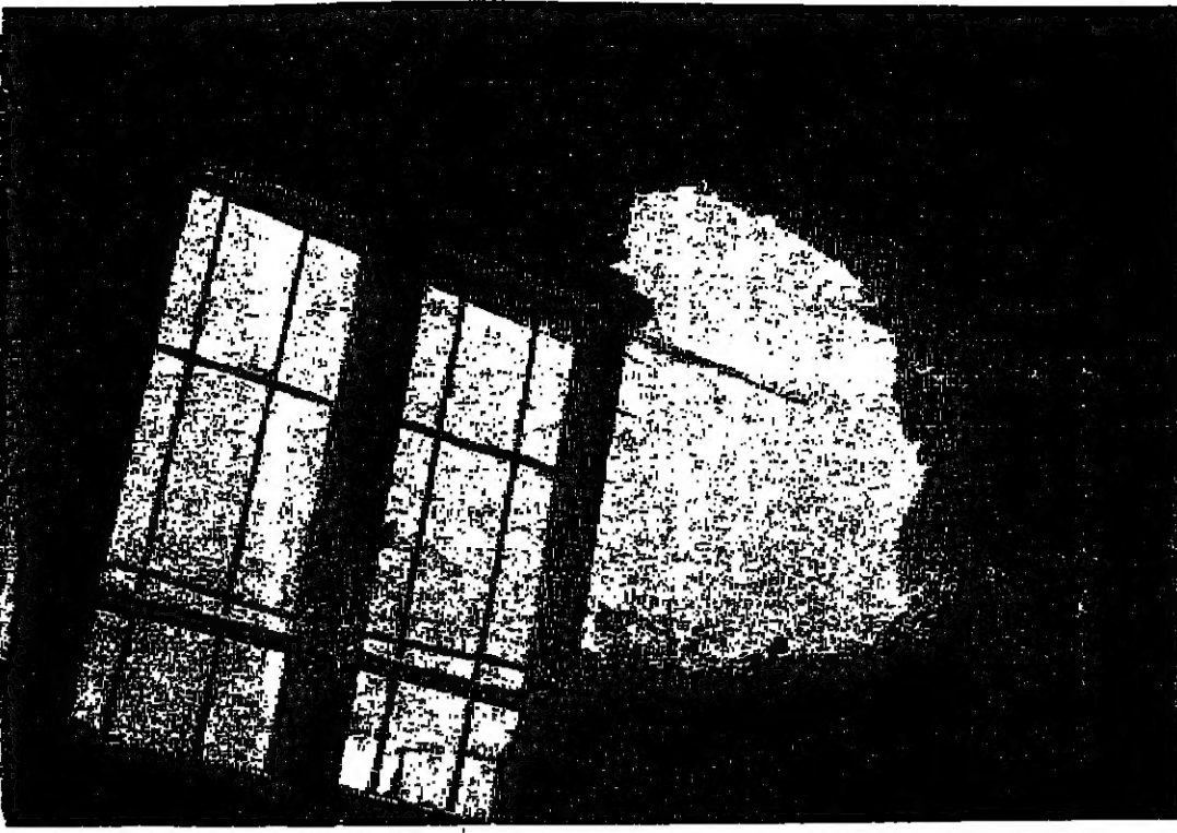
سقطت قنبلة على مبنى مدرسة الكرامة خلال العدوان الفادر فأحدثت هذه الفجوة في احد جدران المدرسة

اعلان وزارة الشؤون الاجتماعية والعمل بحاجة إلى ممرضة للعمل في بيت الطفولة في عمان، عمل من تجد في نفسها الكفاءة برجعة رئيس قسم شؤون الموظفين بالوزارة المذكورة قبل تاريخ ١٥-٢-١٩٦٨